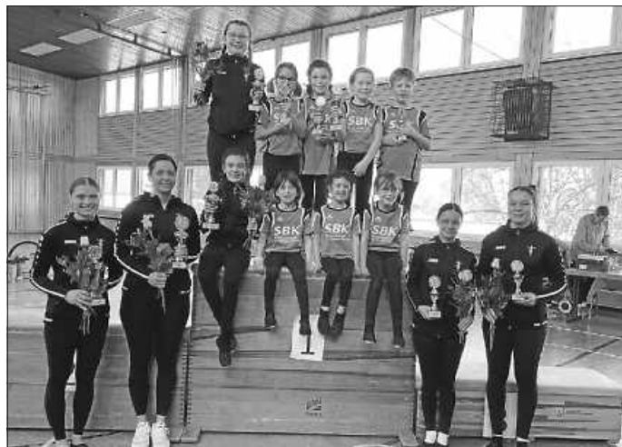
Alle Sportler/-innen RV Herrenzimmern