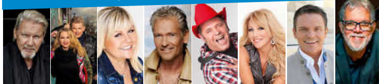
Johnny Logan, Markus & Yvonne (Neue Deutsche Welle), Gaby Baginsky, Stefan Mross, Olaf Berger, Rosanna Rocci, Markus Becker und Wolfgang Trepper mit einer Comedy Show.