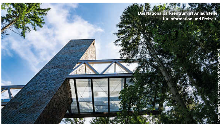
Das Nationalparkzentrum ist Anlaufstelle für Information und Freizeit.

Alles in allem ein echter Grund zum Feiern! „Über das gesamte Jahr wollen wir Bürgerinnen und Bürger bei Führungen und Veranstaltungen dazu einladen, den Nationalpark vor Ort und gemeinsam mit uns zu erleben. Wir wollen genau hinschauen, auf die großen und kleinen, die sichtbaren und verborgenen Veränderungen“, sagt Schlund voll Vorfreude auf ein volles Programm zum Jubiläumsjahr. (pm/red)