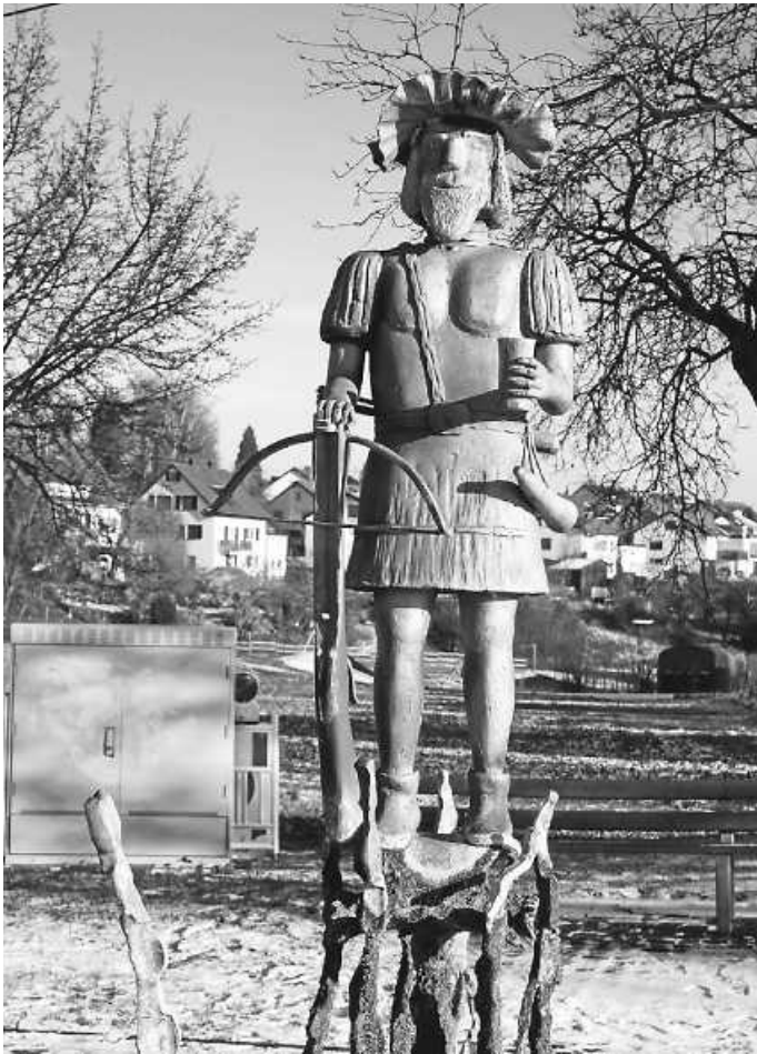
Das Bild zeigt den Graf-Werner-Brunnen

die Idee, auf dem Brunnen ein Motiv des Grafen von Zimmern zu installieren. Die historische Nachbildung wurde in hervorragender Handwerkskunst von Erhard Bantle, dem örtlichen Schmiedemeister, aus verzinktem Stahl geschmiedet.