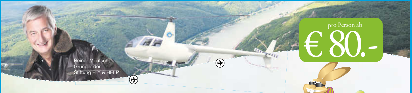
Reiner Meutsch, Gründer der Stiftung FLY & HELP