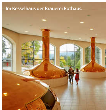
Im Kesselhaus der Brauerei Rothaus.

Also auch bei uns im Ländle. Mit einer Vielzahl an Brauereien, von historisch bis modern, bietet Baden-Württemberg vom klassischen Pils über traditionelle Klosterbieren bis hin zu ausgefallenen Craftbier-Kreationen eine Geschmacksvielfalt, die ihresgleichen sucht. Und der Tag des deutschen Bieres bietet Anlass für die Brauereien, diese zu zelebrieren. Ob auf Bierfesten oder bei speziellen Verkostungen – der Tag feiert das, was Baden-Württemberg in Sachen Bier so einzigartig macht.