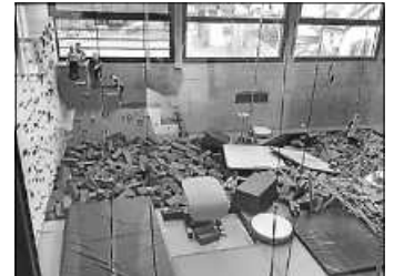
Gruppenbild in der TuB