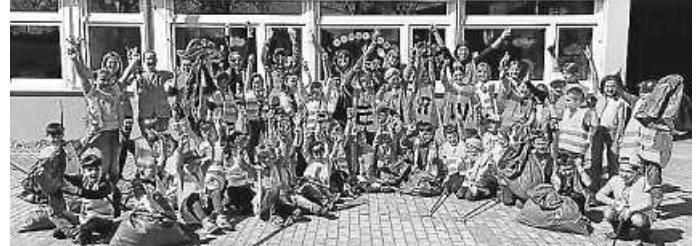
Gruppenbild Standort Böisingen

Am Freitag, dem 12.04.2024, fand an der Grundschule Böisingen & Herrenzimmern eine Müllsammelaktion statt. Gemeinsam mit einigen helfenden Eltern und unterstützt durch die ENRW, welche Müllgreifer und Warnwesten zur Verfügung stellte, machten sich die Schülerinnen und Schüler in Kleingruppen auf den Weg, um unsere beiden Dörfer aufzuräumen. Die Kinder waren mit voller Begeisterung dabei.