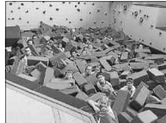
Gruppenbild in der TuB

Alle Klassen der GS Böisingen & Herrenzimmern durften im Zeitraum von Ende Februar bis Anfang März im Rahmen des Projektes „Lernen mit Rückenwind“ die neue Turn- und Bewegungslandschaft (TuB) in Villingendorf besuchen. Die Kinder verbrachten jeweils einen Vormittag voller Bewegung, Spiel und Spaß. Dabei kamen die Kinder nicht nur ordentlich ins Schwitzen, sondern es wurden auch Ausdauer, Selbstvertrauen und gruppendynamische Prozesse gefördert. Die Finanzierung erfolgte komplett über die Mittel aus „Lernen mit Rückenwind“. Die Kinder wurden von erfahrenen Mitarbeiterinnen und Mitarbeitern des SV Villingendorf betreut und angeleitet. Besonders beliebt war die Schnitzelgrube. Viele Kinder überwandern ihre anfängliche Scheu und wagten den Sprung in die Tiefe.