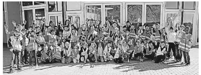
Gruppenbild Standort Herrenzimmern