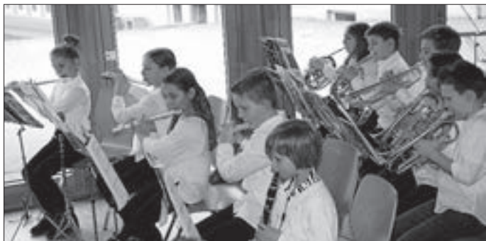
Die Bläserklasse in Aktion