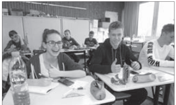
Impressionen aus dem Mathe-Trainingslager der neunten Klasse der Böisinger Werkrealschule.

Das Ganze wurde natürlich aufgelockert durch gemeinsames Kochen in der Schulküche, so wie viel Sport und Kino in der Turnhalle. Intensive Lernphasen, unterbrochen durch entspannte Erlebnis- und Spaßmomente in der Gruppe. Durch dieses Trainingskonzept erhofft sich das Klassenteam einen guten Erfolg bei den Prüfungen.