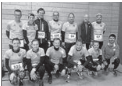
Die Laufgruppe vom VfB Böisingen lief bei herbstlichen Temperaturen beim Adventslauf in Weiden zur Hochform auf