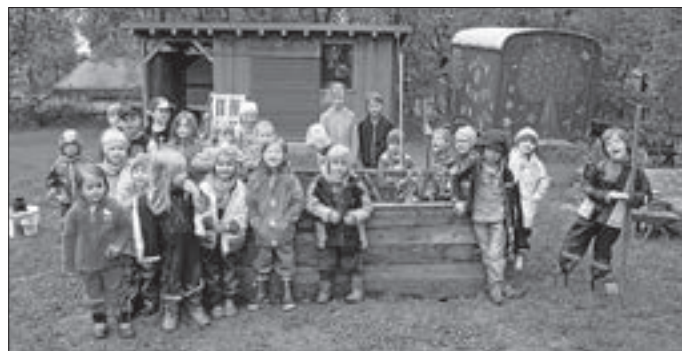
...nach getaner Arbeit am neuen Hochbeet.....

Die Naturgruppenkinder waren mit viel Feuereifer dabei, um das neue Hochbeet im Vereinsgarten mit Gemüsesetzlingen zu bepflanzen. Zudem wurden die selbst mitgebrachten Sonnenblumensetzlinge in ein Blumenbeet eingepflanzt. Im Anschluss wurden dann noch Jonglierbälle gebastelt, bevor man sich dann bei Knabbereien und Erdbeerbowle den arbeitsreichen Tag versüßte.