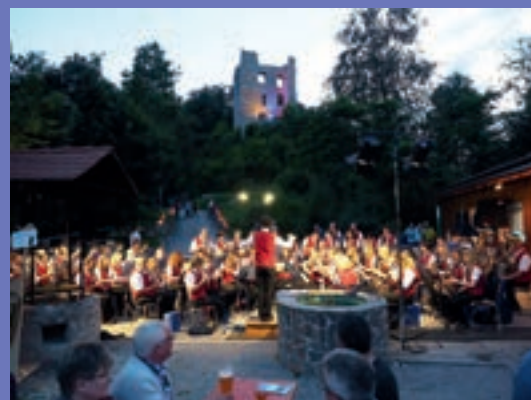
Sommerserenade im Jubiläumsjahr 2016