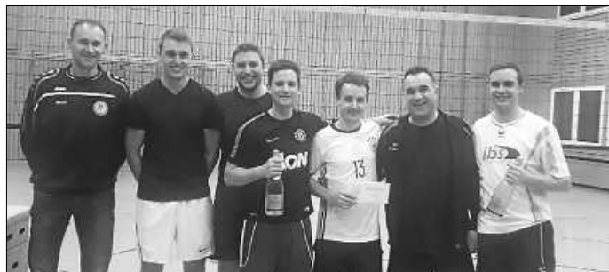
Turniersieger 2020: Team Speed Schiss