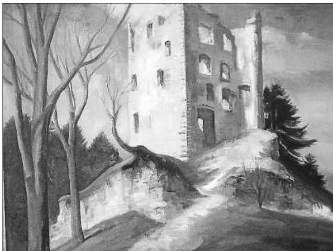
Paul Kälberer: Ruine Herrenzimmern 1946