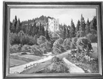
Anton Munding: Ruine Herrenzimmern

Anton Munding († 1976 in Oberndorf am Neckar). Munding schuf rund 3000 Bilder, meist in Öl auf Leinwand. Seine Bilder finden heute noch auf Kunstauktionen Liebhaber und Käufer. Zu seinen Lebzeiten war er weniger gefragt. Manchen Bauernhof malte er für eine warme Mahlzeit und eine Schlafstatt.