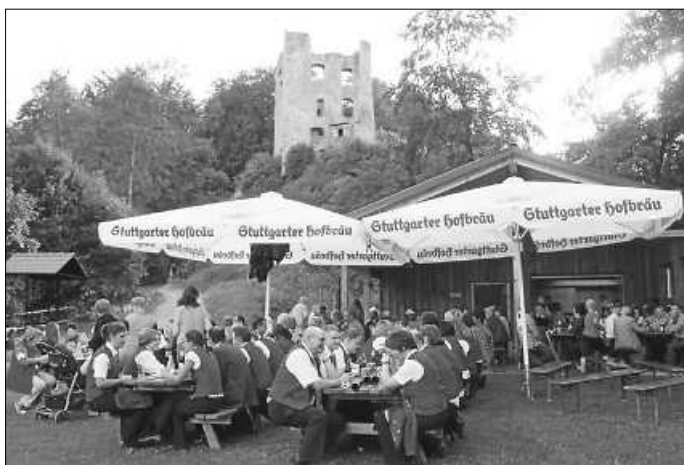
Wir bedienen Sie auf dem überdachten Vorplatz des Burgstübles und auf der Schlosswiese