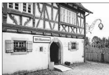
Bild: Das Eingangsgebäude des Freilichtmuseums bleibt leider bis auf weiteres geschlossen.