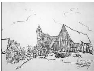
Kirchstr. Herrenzimmern im Jahre 1934 von Guido Schreiber